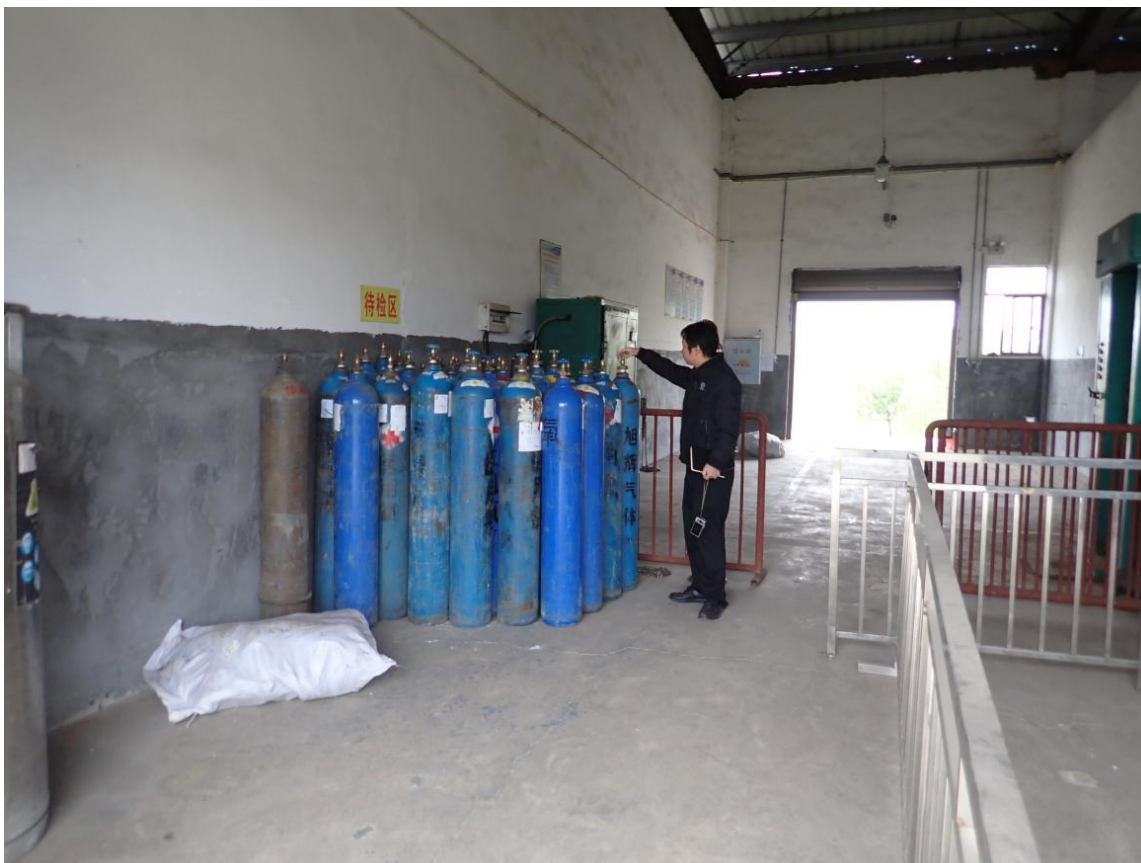
评价人员现场勘察图片一